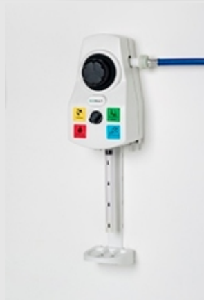
⌘ SWISS MIX DESING 830