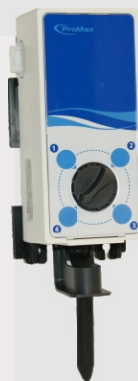
⌘ SWISS MIX PROF-4