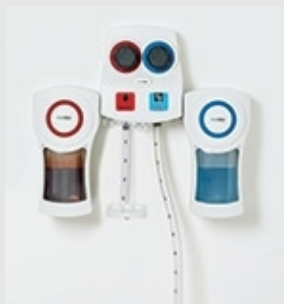
⌘ SWISS MIX DESING 824 / 825