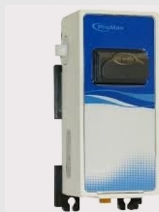
⌘ SWISS MIX PROF-1