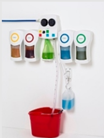
⌘ SWISS MIX DESING 832