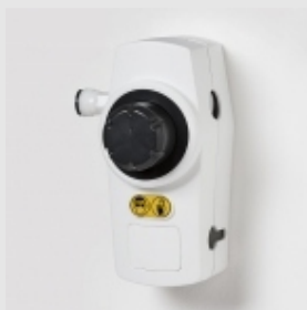
⌘ SWISS MIX DESING 826 / 827